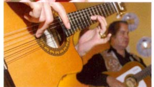
Influence gypsy oblige, la Camargue se déguste aussi sous un air de guitare

Hôtel Les villages du soleil, à partir de 60 € la nuit en chambre double.