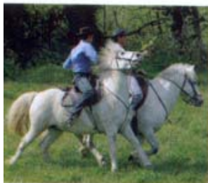
Dans les deltas, l'art équestre est art de vivre.