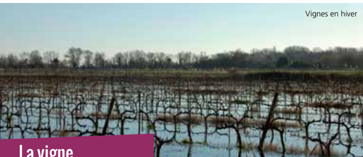
Vignes en hiver

Le chemin de Saint-Jacques de Compostelle rappelle l'apôtre Jacques (présent durant la vie de Jésus) qui aurait été décapité vers 41-44. Ce n'est que sous le règne de Charlemagne et d'Alphonse II le Chaste (759-842) que son tombeau est découvert. De nombreux fidèles lui rendent hommage sur cette route. La Via Tolosana au départ d'Arles est l'un des quatre itinéraires vers le tombeau de Saint-Jacques.