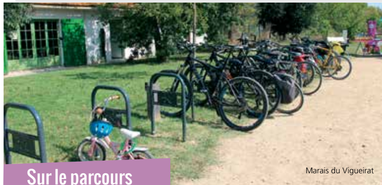
Marais du Vigueirat

Attention, veuillez consulter la météo avant de partir et éviter de randonner par temps de mistral