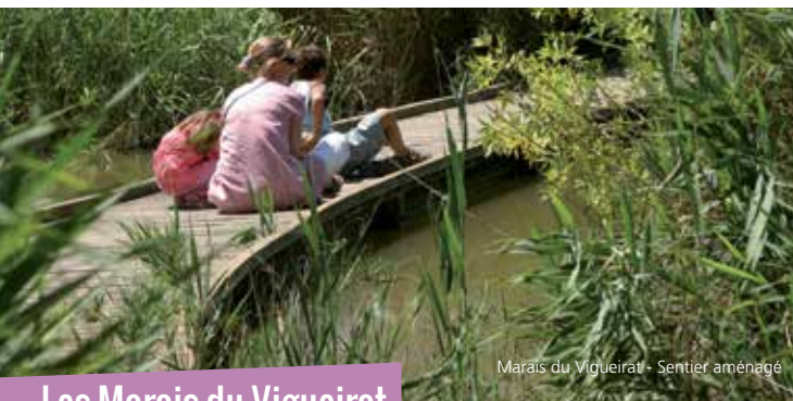
Marais du Vigueirat - Sentier aménagé

L'itinéraire croise une conduite de type gazoduc ou saumoduc qui alimente la zone industrielle et portuaire de Fos-sur-Mer. Un saumoduc est une canalisation destinée à transporter de la saumure, c'est-à-dire de l'eau salée. Les saumoducs sont généralement des canalisations industrielles, amenant la saumure depuis des lieux de production (marais salants, cavités salines, mines de sel gemme...) vers des usines de transformation.