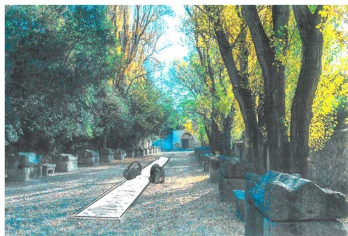
1 2 stainless steel (mirror) 1800cm (18m) x 120cm (1.20m) x 2cm = 2 pieces Natural stone 130 x 130cm = 2 pieces

Au printemps 2022, ouvrira au cœur de l'Hôtel Vernon, hôtel particulier construit entre le XVI ème et le XVIII ème siècle, situé dans les vieux quartiers d'Arles, Lee Ufan Arles espace d'exposition sur 3 étages présentant des œuvres de l'artiste et proposant également une librairie boutique et des espaces de médiation et de réception. Après ses expositions au château de Versailles en 2014 ou au Centre Pompidou Metz en 2019, Lee Ufan écrit une nouvelle page de sa relation passionnée avec la France.