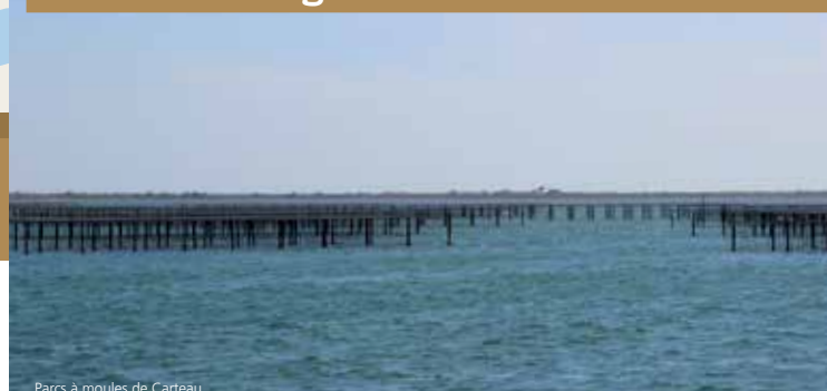
Parcs à moules de Carteau

6 Si vous empruntez l'extension jusqu'à la plage de Carteau, vous serez au cœur de l'anse de Carteau : haut-lieu méditerranéen de production de coquillages. L'Anse de Carteau constitue un site exceptionnel pour la culture des moules et des huîtres. La «moule de Carteau» et nouvellement «l'huître de Carteau» sont des coquillages de qualité, charnues et goûteux, à découvrir et à apprécier.