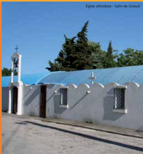
Eglise orthodoxe - Salin-de-Giraud

Rendez-vous à Salin-de-Giraud. Dans le village, au feu tricolore continuez tout droit puis prenez la 1ère à droite direction centre-ville. L'Office de Tourisme est situé rue Tournayre, 150m avant les arènes.