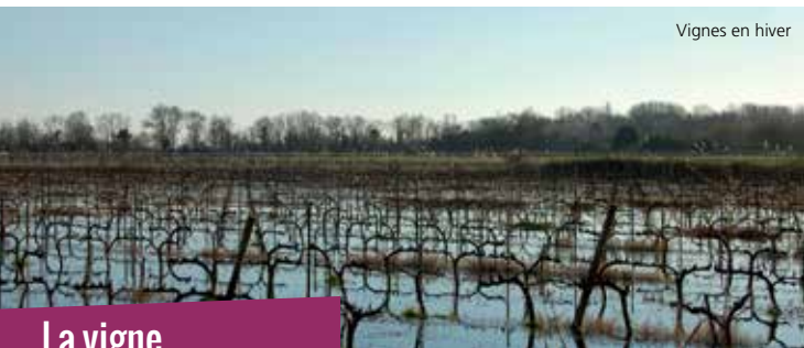
Vignes en hiver

Le chemin de Saint-Jacques de Compostelle rappelle l'apôtre Jacques (présent durant la vie de Jésus) qui aurait été décapité vers 41-44. Ce n'est que sous le règne de Charlemagne et d'Alphonse II le Chaste (759-842) que son tombeau est découvert. De nombreux fidèles lui rendent hommage sur cette route. La Via Tolosana au départ d'Arles est l'un des quatre itinéraires vers le tombeau de Saint-Jacques.