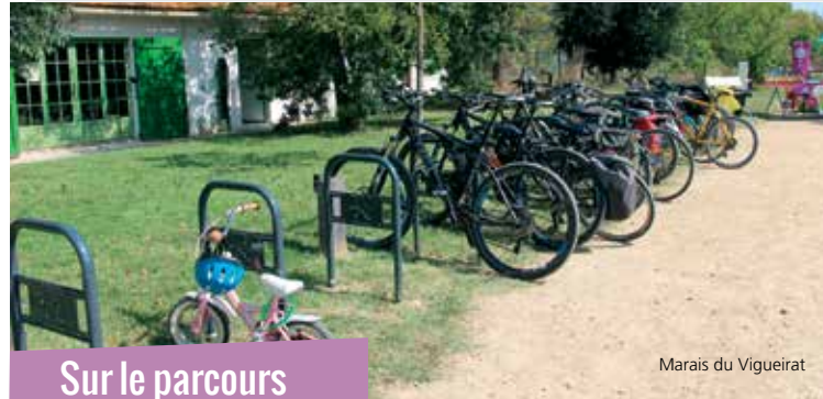
Marais du Vigueirat

Attention, veuillez consulter la météo avant de partir et éviter de randonner par temps de mistral