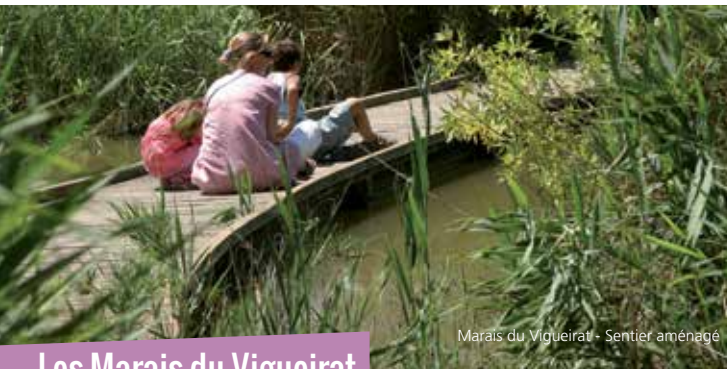
Marais du Vigueirat - Sentier aménagé

L'itinéraire croise une conduite de type gazoduc ou saumoduc qui alimente la zone industrielle et portuaire de Fos-sur-Mer. Un saumoduc est une canalisation destinée à transporter de la saumure, c'est-à-dire de l'eau salée. Les saumoducs sont généralement des canalisations industrielles, amenant la saumure depuis des lieux de production (marais salants, cavités salines, mines de sel gemme...) vers des usines de transformation.