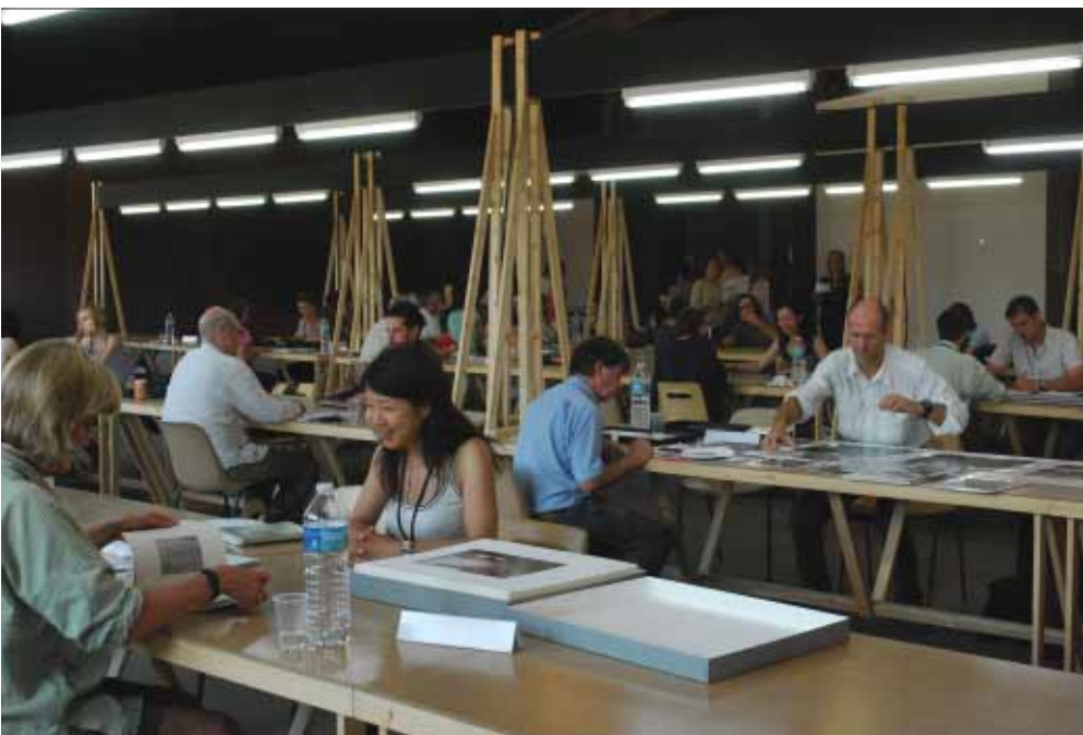
Acima, mesas para leitura de portfólio, uma das atividades mais disputadas do festival; abaixo, uma exposição de livros de fotografia que concorreram a um prêmio de melhor projeto editorial