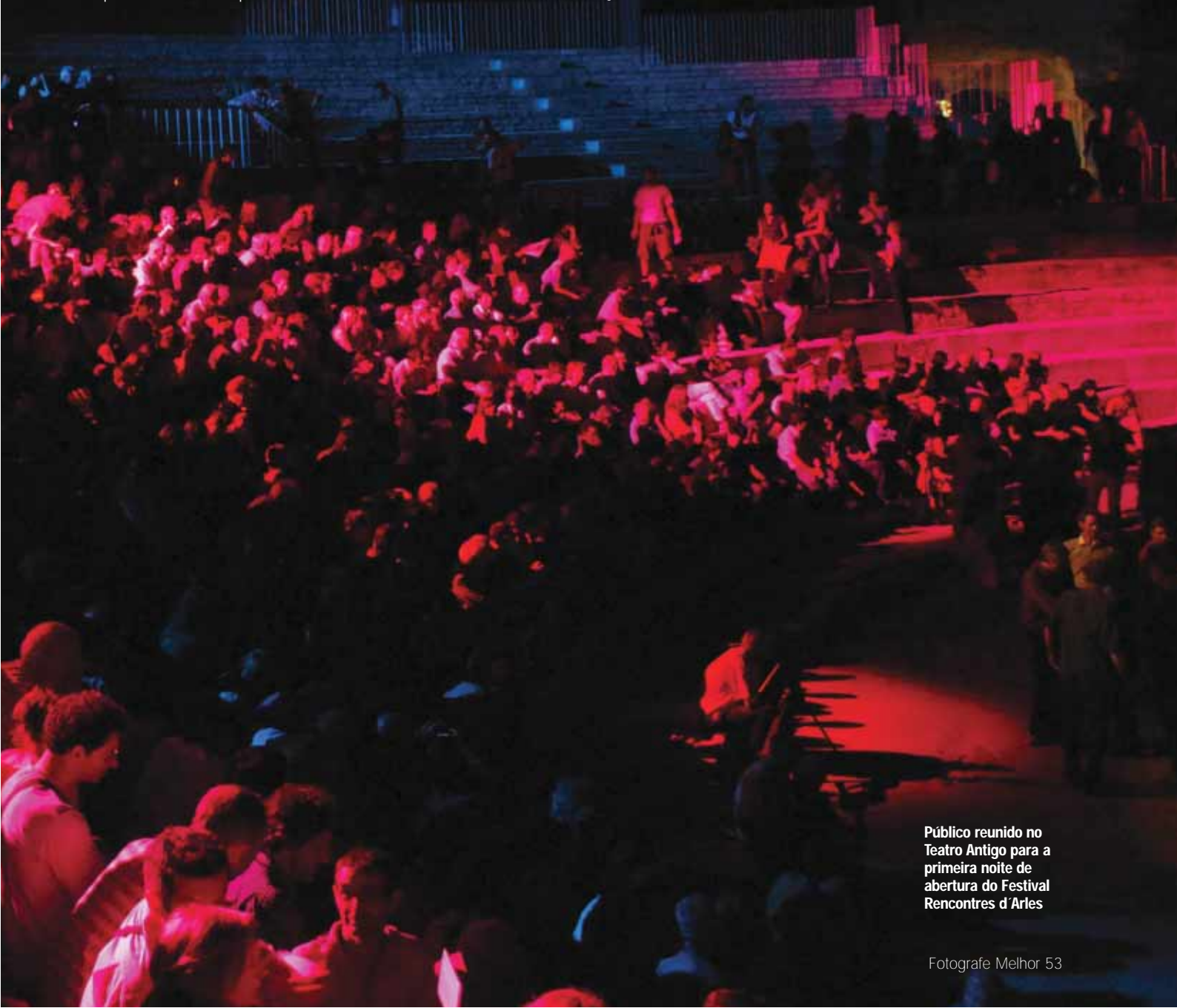
Público reunido no Teatro Antigo para a primeira noite de abertura do Festival Rencontres d'Arles