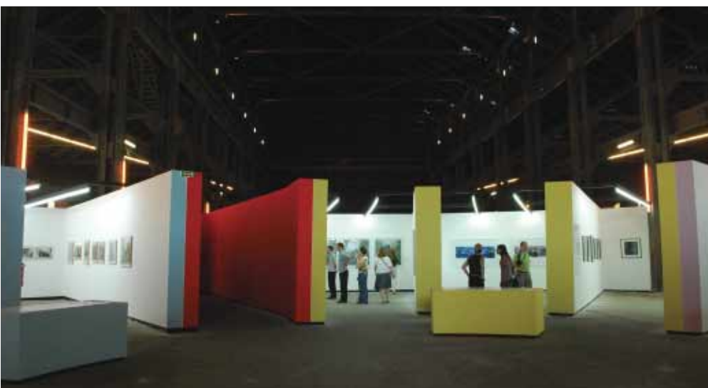
Local no Parc des Ateliers onde estavam reunidas as exposições dos candidatos ao Prix Découverte

do artista são as fotografias publicadas em jornais e revistas franceses, que são colocadas em novos enquadramentos quando misturadas a reflexões filosóficas e recordações pessoais. Um trabalho bastante denso e tocante.