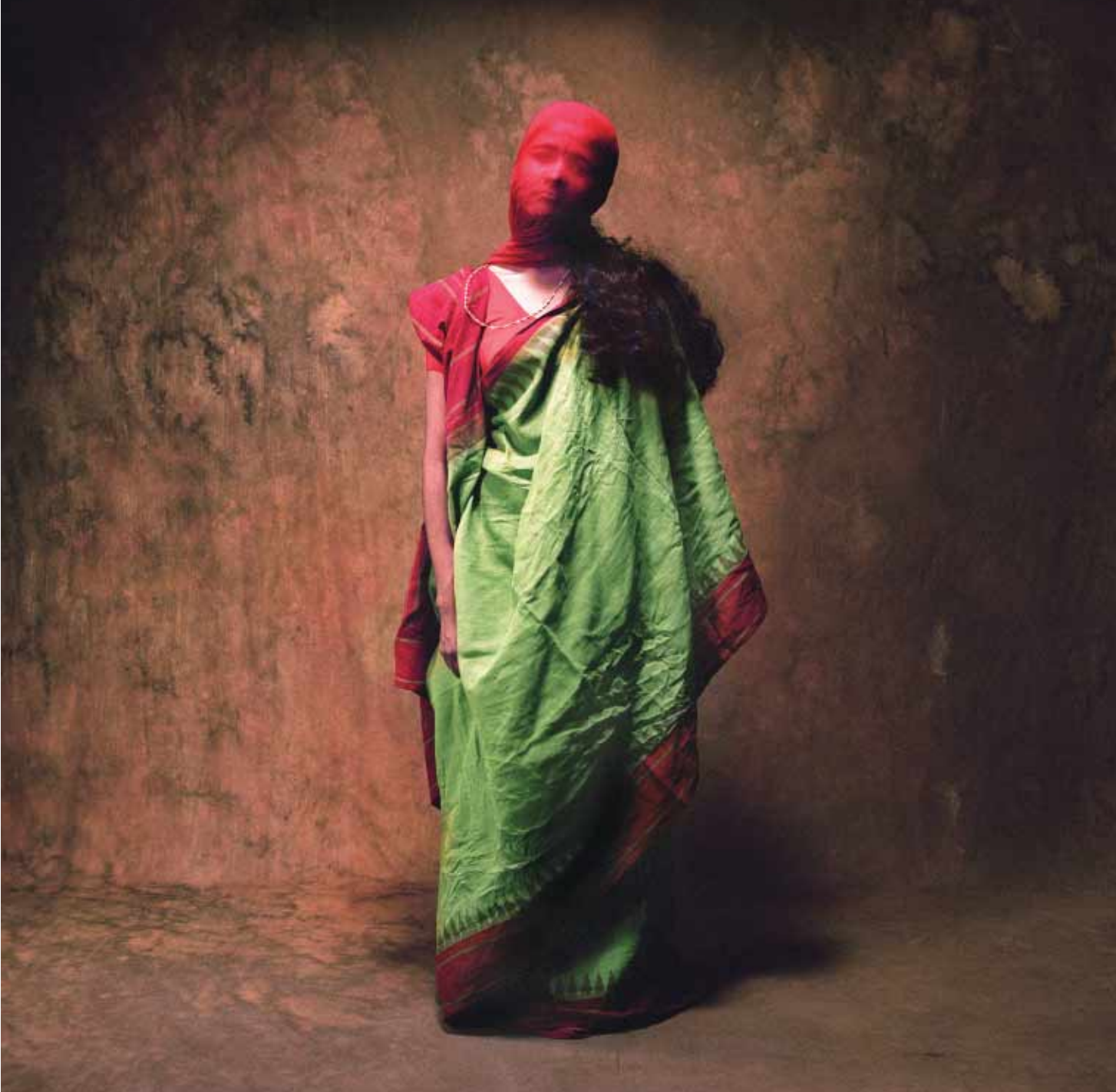
Retrato do fotógrafo indiano Achinto Bhadra, que faz parte de um ensaio tocante, feito com garotas recolhidas para reabilitação em uma ONG de Calcutá

Estado turco. Na série, a monotonia e a repetição são propositais. Todas as fotos foram feitas em p&b, com a mesma objetiva, à mesma distância das pessoas retratadas. Os vestidos são todos muito parecidos.