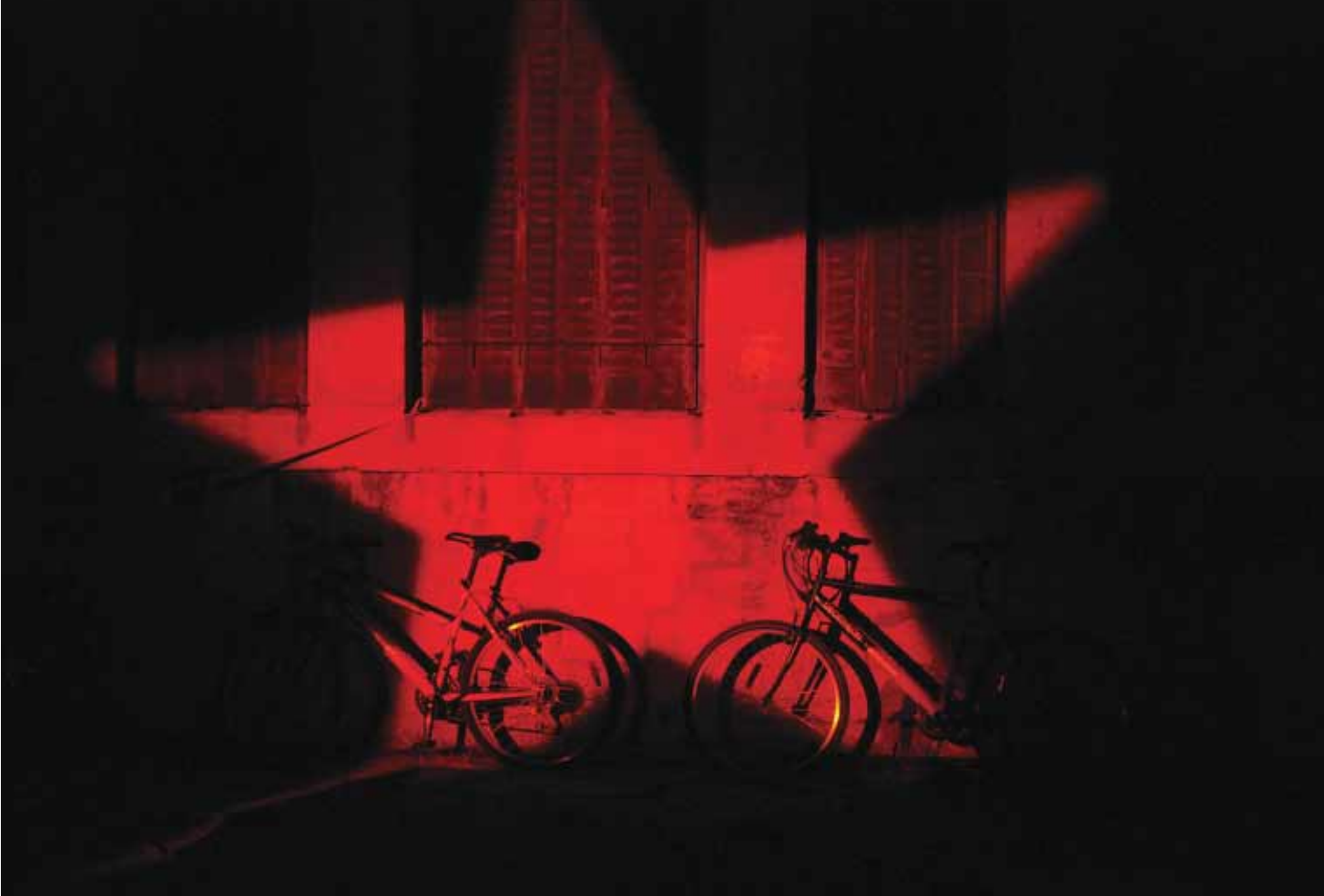
Iluminação decorativa durante a Noite da Europa, um amplo panorama que contou com a projeção de trabalhos de fotógrafos de 27 países europeus

e o projeto arquitetônico definitivo deve ser anunciado na próxima edição do festival, em julho de 2009. O local vai abrigar espaços para exposição e arquivamento de fotografias e vídeos, a sede da organização do festival, da École Nationale Supérieure de la Photographie, da editora Actes Sud e da Fundação LUMA, voltada para o incentivo da arte e de artistas, além de um cinema, zonas comerciais e residenciais, um complexo hoteleiro e um espaço onde será possível no futuro criar uma nova estação ferroviária para a cidade. Por enquanto, o Parc des Ateliers está tomado por exposições de fotografia, o que indica a importância simbólica que o festival ganhou na cidade.