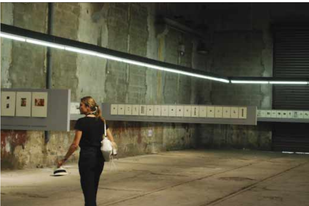
A exposição do alemão Joachim Schmid, que desde 1982 recolhe fotos encontradas em lixos