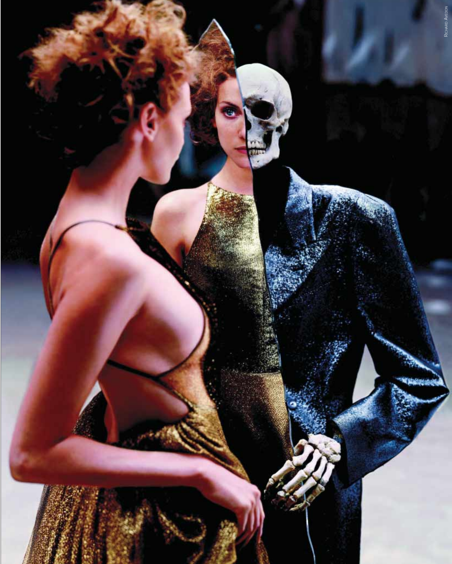
Ensaio de Richard Avedon, produzido para a revista The New Yorker , em 1995, mostra a estranha relação entre uma modelo e seu parceiro, um esqueleto