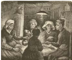
Vincent van Gogh, Les Mangeurs de pommes de terre , 1885 Lithographie 26,5 x 32 cm Van Gogh Museum, Amsterdam (Vincent van Gogh Foundation)