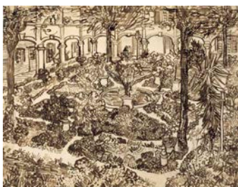
Vincent van Gogh, Le Jardin de l'hôpital , 1889 Mine de plomb, encre brune et noire à la plume de roseau, à la plume et au pinceau, sur papier vergé 46,6 x 59,9 cm Van Gogh Museum, Amsterdam (Vincent van Gogh Foundation)