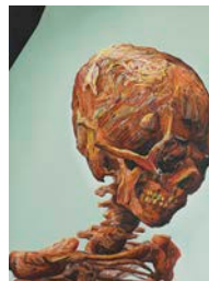
Suffer Well , 2007 Huile sur panneau 157 x 120 cm Tous droits réservés