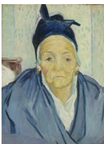
Vieille Arlésienne, Arles, février 1888 Huile sur toile, 58 x 42 cm Van Gogh Museum, Amsterdam (Vincent van Gogh Foundation)