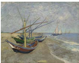
Bateaux de pêche sur la plage des Saintes-Maries-de-la-Mer, Arles, juin 1888 Huile sur toile, 65 x 81,5 cm Van Gogh Museum, Amsterdam (Vincent van Gogh Foundation)