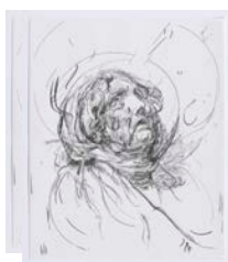
Drawing 13 (d'après Greuze/ Rubens) , 2015 Encre de Chine sur papier, Pergamenata blanc 50 x 40,8 cm, encadré 72,3 x 62.6 x 3 cm