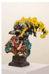
Armand Roulin , 2016 Peinture à l'huile et acrylique sur structure d'acier et de bronze 88 x 66 x 66 cm