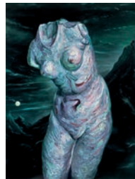
Misogyny , 2006 Huile sur panneau 159 x 122,5cm Tous droits réservés