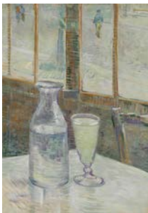
Table de café et absinthe, Paris, février-mars 1887 Huile sur toile, 46,3 x 33,2 cm Van Gogh Museum, Amsterdam (Vincent van Gogh Foundation)