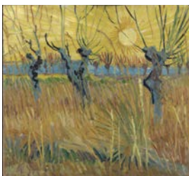
Saules têtards au soleil couchant, Arles, mars 1888 Huile sur toile sur carton, 31,6 x 34,3 cm Kröller-Müller Museum, Otterlo