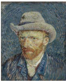
Autoportrait au chapeau de feutre gris, Paris, septembre-octobre 1887 Huile sur toile, 44,5 x 37,2 cm Van Gogh Museum, Amsterdam (Vincent van Gogh Foundation)