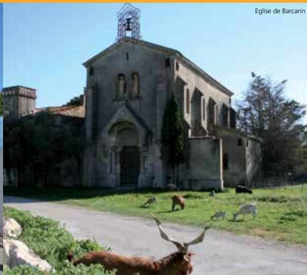
Eglise de Barcarin