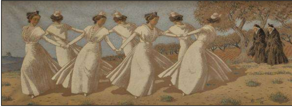
Aquarelle de Léo LELÉE