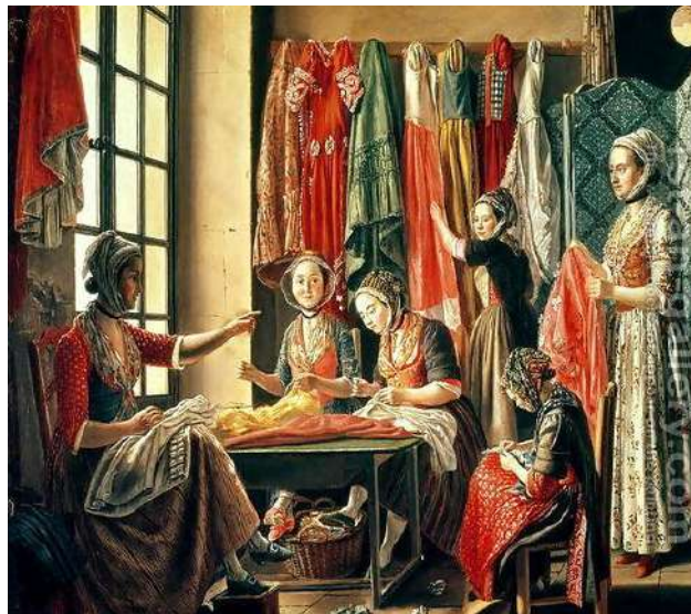
Atelier de couture à Arles (1780) Antoine Raspail

Les premières époques du costume d'Arlésienne seraient dans les années 1715, à l'époque de Louis XV, bien que nous n'ayons pas trouvé de date précise. La première iconographie du costume d'Arlésienne nous vient d'Antoine Raspail avec " l'atelier de couture " peint en 1780. Représentant six arlésiennes, ce tableau montre des couturières à l'ouvrage. En arrière plan, on y voit des robes aux couleurs multiples. C'est alors l'époque de Louis XVI.