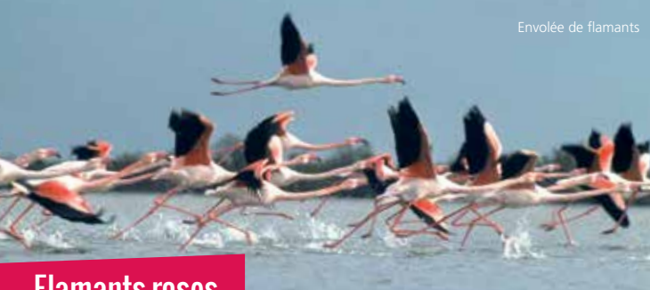
Envolée de flamants