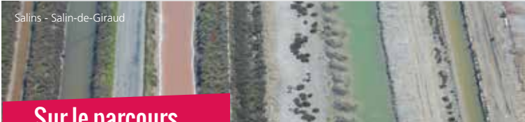
Salins - Salin-de-Giraud

Attention, veuillez consulter la météo avant de partir et éviter de randonner par temps de mistral