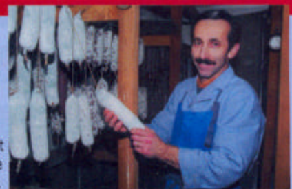
La maison Genin peut se targuer de faire du saucisson depuis 130 ans.

■ Mas de Valériole à Gageron, 13200 Arles, Tél. : 04 90 97 00 38 (Gageron est situé en Camargue entre Grand Rhône et étang de Vaccarès).