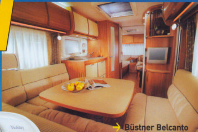
→ Büstner Belcanto