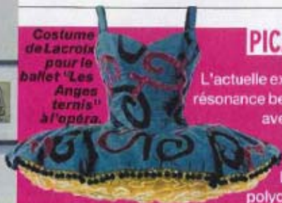
Costume de Lacroix pour le ballet "Les Anges ternis" à l'opéra.