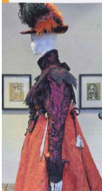
Costume de Lacroix pour "Cyrano de Bergerac" mis en scène par Denis Podalydès.