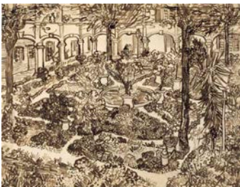
Vincent van Gogh, Le Jardin de l'hôpital , 1889 Mine de plomb, encre brune et noire à la plume de roseau, à la plume et au pinceau, sur papier vergé 46,6 x 59,9 cm Van Gogh Museum, Amsterdam (Vincent van Gogh Foundation)