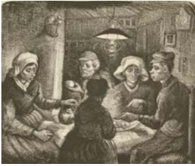
Vincent van Gogh, Les Mangeurs de pommes de terre , 1885 Lithographie 26,5 x 32 cm Van Gogh Museum, Amsterdam (Vincent van Gogh Foundation)