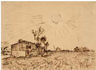
Vincent van Gogh, Champ avec maisons , 1888 Mine de plomb, encre brune à la plume et à la plume de roseau, sur papier vélin 25,8 x 34,9 cm Van Gogh Museum, Amsterdam (Vincent van Gogh Foundation)