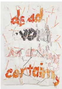
Roni Horn, Hack Wit – Dead Void , 2014 Aquarelle, plume et encre, gomme arabique sur papier aquarelle, ruban adhésif 58,4 x 41,9 cm