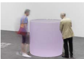
Roni Horn, Untitled ("The immense accretion of flesh which had descended on her in the middle of life like a flood of lava on a doomed city had changed her from a plump active little woman... into something as vast and august as a natural phenomenon. She had accepted this submergence as philosophically as all her other trials, and now, in extreme old age, was rewarded by presenting to her mirror an almost unwrinkled expanse of firm pink and white flesh, in the center of which the traces of a small face survived as if awaiting excavation.") (détail), 2012-13 Blocs de verre coulé Cinq unités, de 124,5 x 137 cm chacune