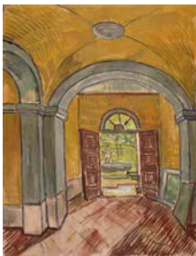
Vincent van Gogh, Vestibule de l'asile , 1889 Craie noire, peinture à l'huile au pinceau, sur papier vergé rose 61,6 x 47,1 cm Van Gogh Museum, Amsterdam (Vincent van Gogh Foundation)