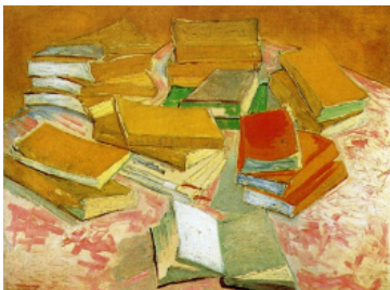
Vincent van Gogh, Piles de romans français , 1887 Huile sur toile, 54,4 x 73,6 cm Van Gogh Museum, Amsterdam (Vincent van Gogh Foundation)

Depuis son ouverture, la Fondation bénéficie d'un prêt annuel du Musée Van Gogh d'Amsterdam, initié entre avril 2014 et mars 2015 avec le tableau Autoportrait à la pipe et au chapeau de paille . À partir du 1 er avril 2015, ce premier prêt sera renouvelé avec la présentation de Piles de romans français , une œuvre peu connue peinte à Paris en 1887. Cette composition aux traits esquissés, empreinte d'un caractère libre, fait apparaître l'influence du « style japonais » que Vincent développera plus tard à Arles.