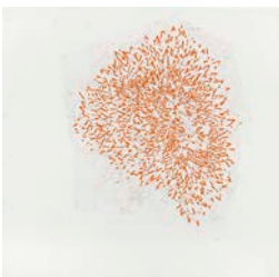
Roni Horn, If 2 , 2011 Pigment en poudre, graphite, fusain, crayon de couleur et vernis sur papier 250,8 x 257,8 cm