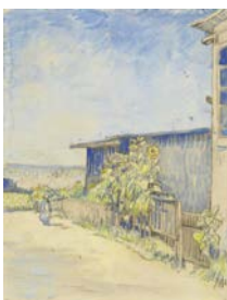
Vincent van Gogh, Petite grange avec tournesols , 1887 Mine de plomb, encre brune à la plume, peinture à l'eau transparente et couvrante, sur papier vélin 31,6 x 24,1 cm Van Gogh Museum, Amsterdam (Vincent van Gogh Foundation)