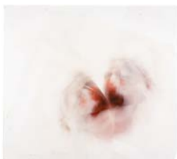
Roni Horn, Clownpout (4) , 2003 Deux photographies couleur, découpées et recomposées 103,5 x 115 cm