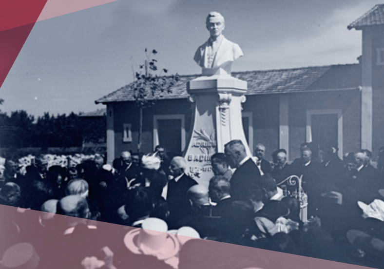
▲ Inauguration du monument en mémoire d'Adrien Badin