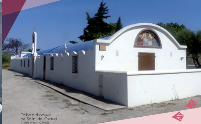
Église orthodoxe de Salin-de-Giraud

Durant la première guerre mondiale, l'usine Péchiney a participé à l'effort de guerre en faisant fonctionner une usine d'armements qui produisait des poudres et des gaz de combat à partir des dérivés de chlores fabriqués par l'usine Solvay, eux-mêmes dérivés de la production de sel de mer. Cette usine a été mise en sommeil entre les deux guerres mondiales.