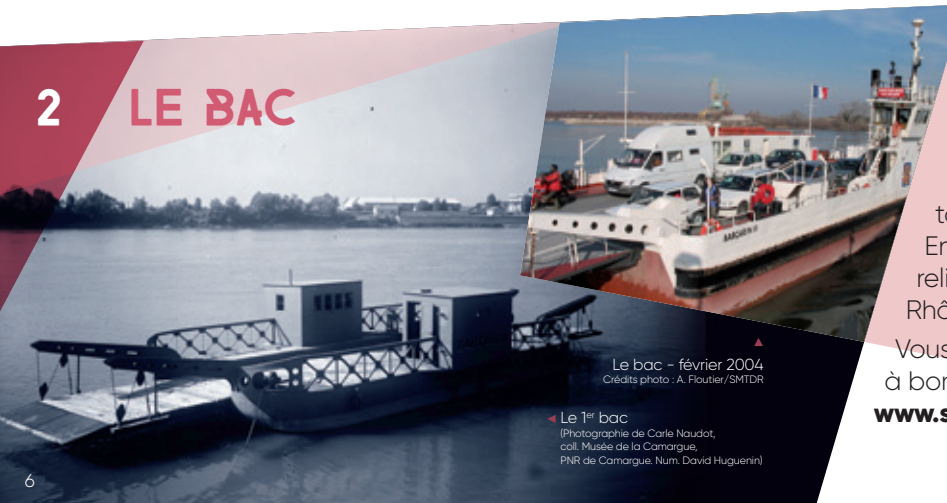
▲ Le bac - février 2004