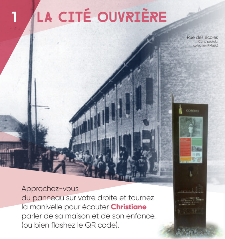
Rue des écoles (Carte postale)

Approchez-vous du panneau sur votre droite et tournez la manivelle pour écouter Christiane parler de sa maison et de son enfance. (ou bien flashez le QR code).